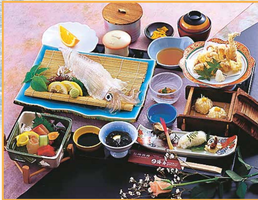
◆いかづくし会席 (いか活造りは、4~6名様盛りにて対応させていただきます。)

呼子名物・活イカをはじめ、鯛、鰯など玄海の荒波で育った天然の海の幸が勢揃い。素材を生かした贅沢な味わいを存分にご賞味いただけます。美味しいものを囲んで親しい方々やお仲間と楽しいひとときをお過ごしください。