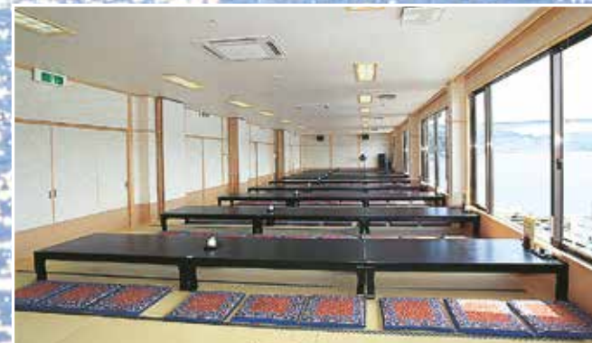
大広間(収容人数/190名)