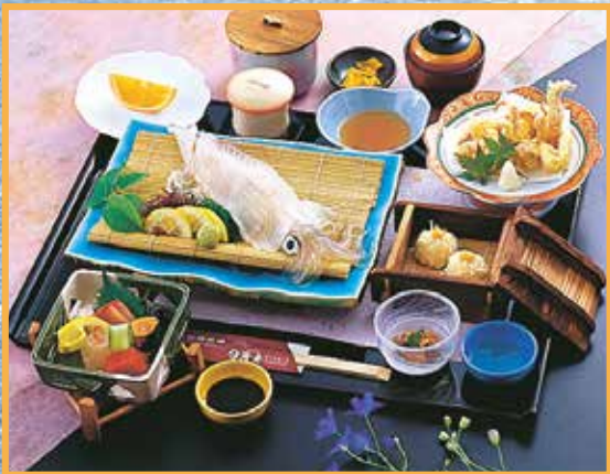
◆いかプラス刺身定食