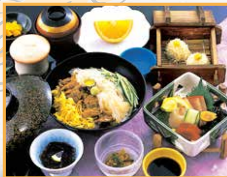
◆いかウニ丼セット